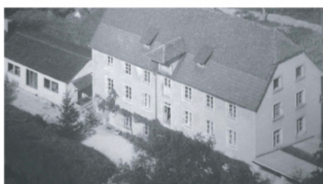
Bureaux, laboratoire, atelier mécanique et de production situés à Grandgourt.