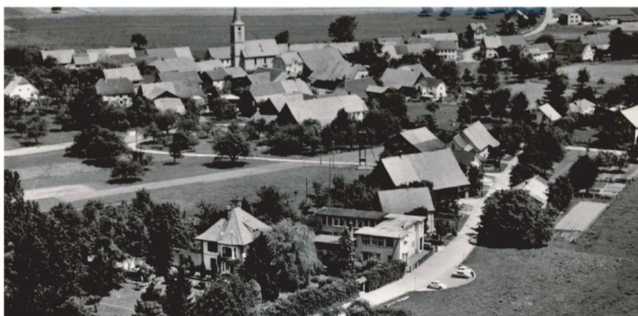
Office, laboratory, Production based in Grandgourt.